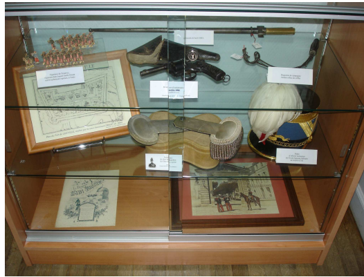
Des souvenirs personnels émouvants

En 1900, le chef de bataillon DRIANT reçoit, à Troyes, le commandement du 1 er Bataillon de Chasseurs à Pied, qui devient rapidement célèbre sous le nom de « Bataillon Driant ». Mais, malgré sa réussite professionnelle, il est la victime de manœuvres politiques qui lui interdisent tout avancement.