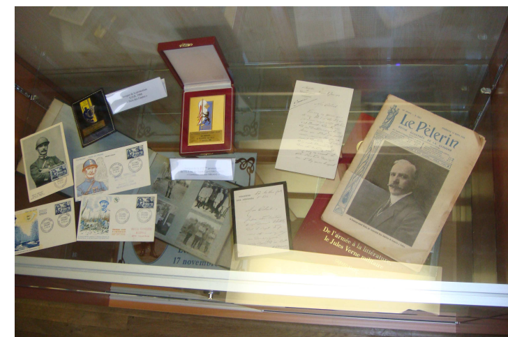
De nombreux documents